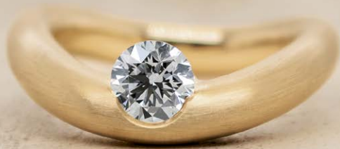
RING LA LUNA / GELBGOLD / 1,00CT